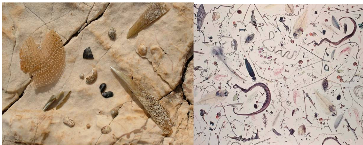
Vít Švajcr, Příroda zblízka, Zátiší, Chorvatsko 200; Shomei Tomatsu