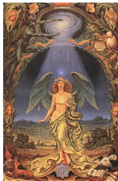
Johfra – Znamení Panny, v ruce drží klas

Tráva obětovala svou krásu pro to, aby lidstvo mělo co jíst, mělo teplo a světlo.