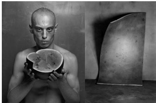
Ivan Pinkava, Advocatus diaboli , 1999, Exercicie III , 2003

Pinkavova výstava na Pražském hradě byla také o symbolech. Zkusme porovnat. Jsou jeho symboly pochopitelnější než Mirky? Pro toho, kdo nezná mytologii a neví, co znamenají latinská jména děl „Exercicie“ nebo „Advocatus Diaboli“ 1 asi těžko pochopí skutečný hluboký význam jeho snímků. Mirky „Hřbitov“ nebo „Moje fialka“ vyzařuje jednoduchostí a „prefíkanou“ důmyslností. Ale zároveň je to tak jednoduché, až je to složité. Nakonec, když pochopíme, řekneme si, „Aha! Jak jsme to nemohli pochopit dříve!“