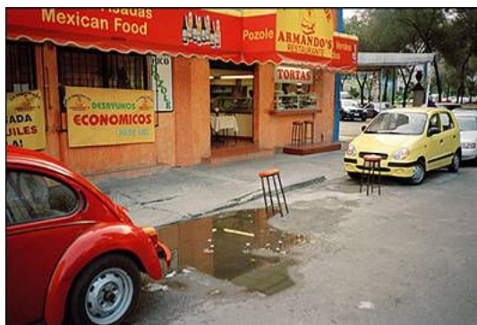
Martin Parr, Park places, Místa k parkování