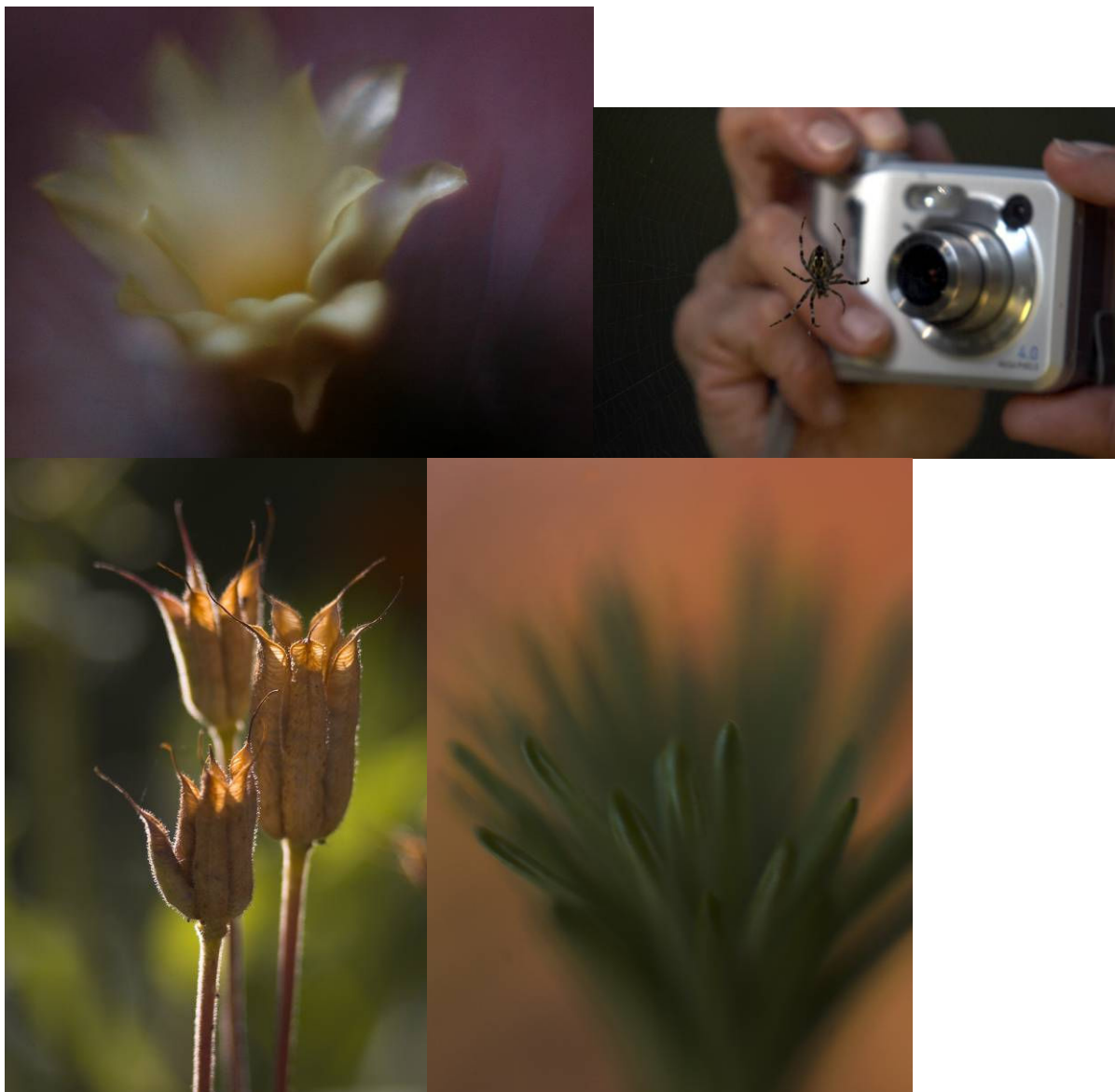
Vladislav Vrba, Příroda zblízka, série, reportáž