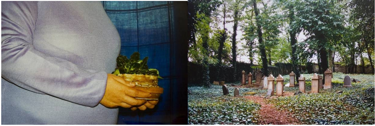
2x Mirka Ferencová, Moje fialka , Prach jsi a v prach se obrátíš, 2007